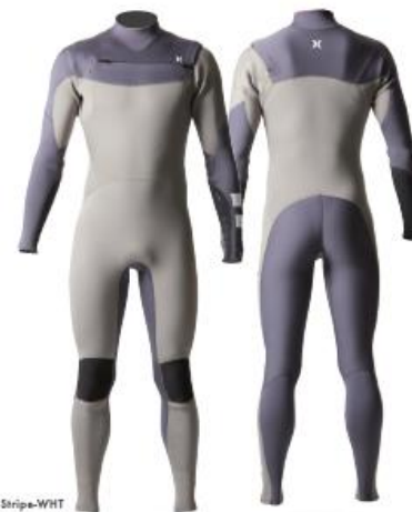
A: GRAY B: CHARCOAL Stripe-WHT

パドルの力を効率的に水中に伝える PADDLE ASSIST を前腕に標準装備。コンペ中に 6 割の時間を費やすといわれるパドルを強力にサポートする。革新的な C-ZIP ONE SHOULDER エントリーを採用し高い防水性とすっきりと快適な着用感を実現した。選び抜いた素材は 3 種類。EDGE は軽さと運動性を突き詰めたオール CSD3 構造。POLAR1 は全方向ストレッチ起毛 S2 を体件にレイアウトし、さらに BODY と下半身にもレイアウトした POLAR2 はセミドライ未満まで保温性を拡張する。運動性能を最大限に引き出す FLEXFORM PATTERNING を採用。コンペティションからフリーサーフィンまで、あらゆるシチュエーションに対応可能なモデル。日本製。