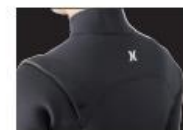
SHOULDER FREE PANEL