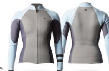
A: ICE BLUE B: GRAY C: CHARCOAL