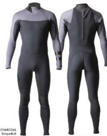
A: BLACK B: CHARCOAL Stripa=BLK

過酷なヘビーウオーター・コンディションに対応すべく開発されたオーセンティックなバックジップモデル。首の動きに追随する HYDRO NECK SEAL がエリからの水の侵入をしっかりガード。ストレッチバリアーとショートジップを組み合わせた BARRIER ENTRY を採用し、ジップからの浸水を防ぎ高い防水性を確保した。妥協が許されないシリアスな環境に挑むサーファーからオールラウンド・サーファーにお勧め。日本製。