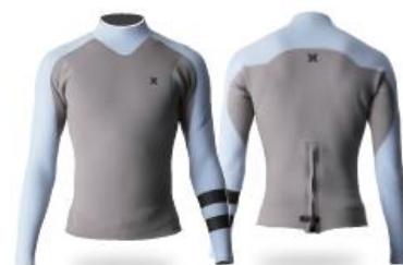
A: ICE BLUE B: GRAY Stripe-BLK