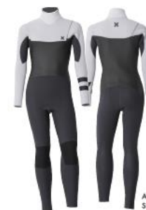
A: CHARCOAL B: WHITE Strip=BLK