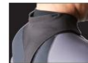
HYDRO NECK SEAL

過酷なヘビーウオーター・コンディションに対応すべく開発されたオーセンティックなバックジップモデル。首の動きに追随する HYDRO NECK SEAL がエリからの水の侵入をしっかりガード。ストレッチバリアーとショートジップを組み合わせた BARRIER ENTRY を採用し、ジップからの浸水を防ぎ高い防水性を確保した。妥協が許されないシリアスな環境に挑むサーファーからオールラウンド・サーファーにお勧め。日本製。