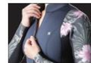
FRONT OPEN ZIPPER

楽に脱着できるウィメンズ専用のフロントオープンジップモデル。防水性と保温性に優れ、動体観測から生みだされたFLEXFORM PATTERNINGがシンプルなデザインと融合し高い運動性もキープ。膝の運動性と耐久性を両立するTUFF KNEE SHIELD、手首からの浸水を防ぐDRY CUFF。トレンド重視ならボートネックもオーダー可能です。ボディは肌触りがよく伸縮に優れるCSD3、またはサポート性がよくコストパフォーマンスが高いNITROから選択可能。日本製。