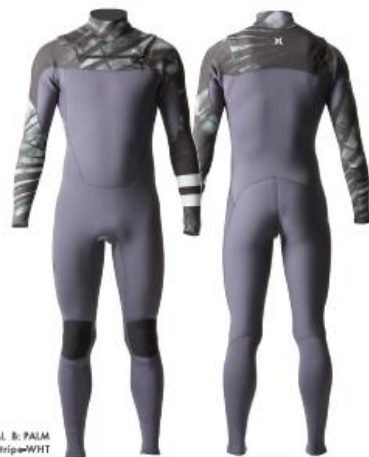
A: CHARCOAL B: PALM Stripa=WHIT

浸水を抑えつつスムーズな脱着が可能に。 快適な着用感と高い運動性をさらにアップ。