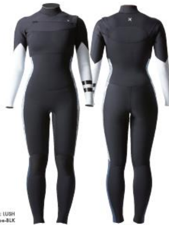
A: BLACK B: WHITE C: LUSH Stripe-BLK

コンペティションからフリーサーフィンまで あらゆる女性サーファーに最適な高性能スーツ。