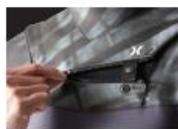
HYDRO SEAL ENTRY

使い勝手がよく着脱性が抜群の HYDRO SEAL ENTRY 4.4 システムをネックホールに採用したトップアスリートモデル。快適な着用感と優れた運動性が特長だ。究極のパフォーマンスをサポートする FLEXFORM PATTERNING や、膝の運動性と耐久性を両立する TUFF KNEE SHIELD、手首からの浸水を防ぐ DRY CUFF など、コンペティターからフリーサーファーまで、あらゆるユーザーのサーフスタイルにマッチする高機能な日本限定モデル。日本製。