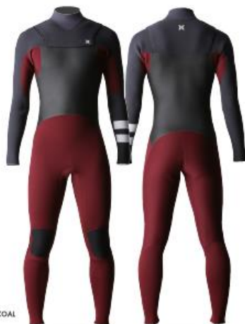
A: WINE B: CHARCOAL

ADVANTAGE PLUS はシンプルでデザインで耐久性とコストパフォーマンスを兼ね備えた、今シーズンデビューするエントリーサーファーに最適なベーシックモデル。HYDROSEAL ENTRY 4.2S が標準装備され、HYDROSEAL ENTRY 4.4 または C-zip にアップグレードもできる。メッシュスキンを胸と背中パネルに配置し体幹部分の冷えを抑え、ボディにはサポート性の高い NITRO をレイアウトし高いフィットネスを提供する。日本製。