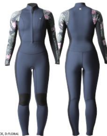
A: SLATE, B: BLACK, C: BLACK, D: FLORAL

楽に脱着できるウィメンズ専用のフロントオープンジップモデル。防水性と保温性に優れ、動体観測から生みだされたFLEXFORM PATTERNINGがシンプルなデザインと融合し高い運動性もキープ。膝の運動性と耐久性を両立するTUFF KNEE SHIELD、手首からの浸水を防ぐDRY CUFF。トレンド重視ならボートネックもオーダー可能です。ボディは肌触りがよく伸縮に優れるCSD3、またはサポート性がよくコストパフォーマンスが高いNITROから選択可能。日本製。